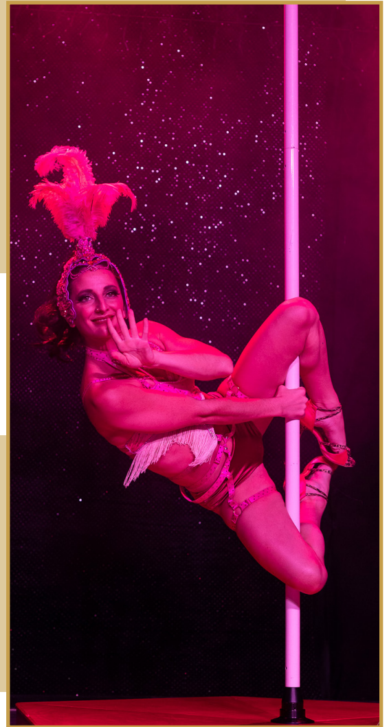
CASQUE SOUPLE, SPÉCIAL POLE DANCE