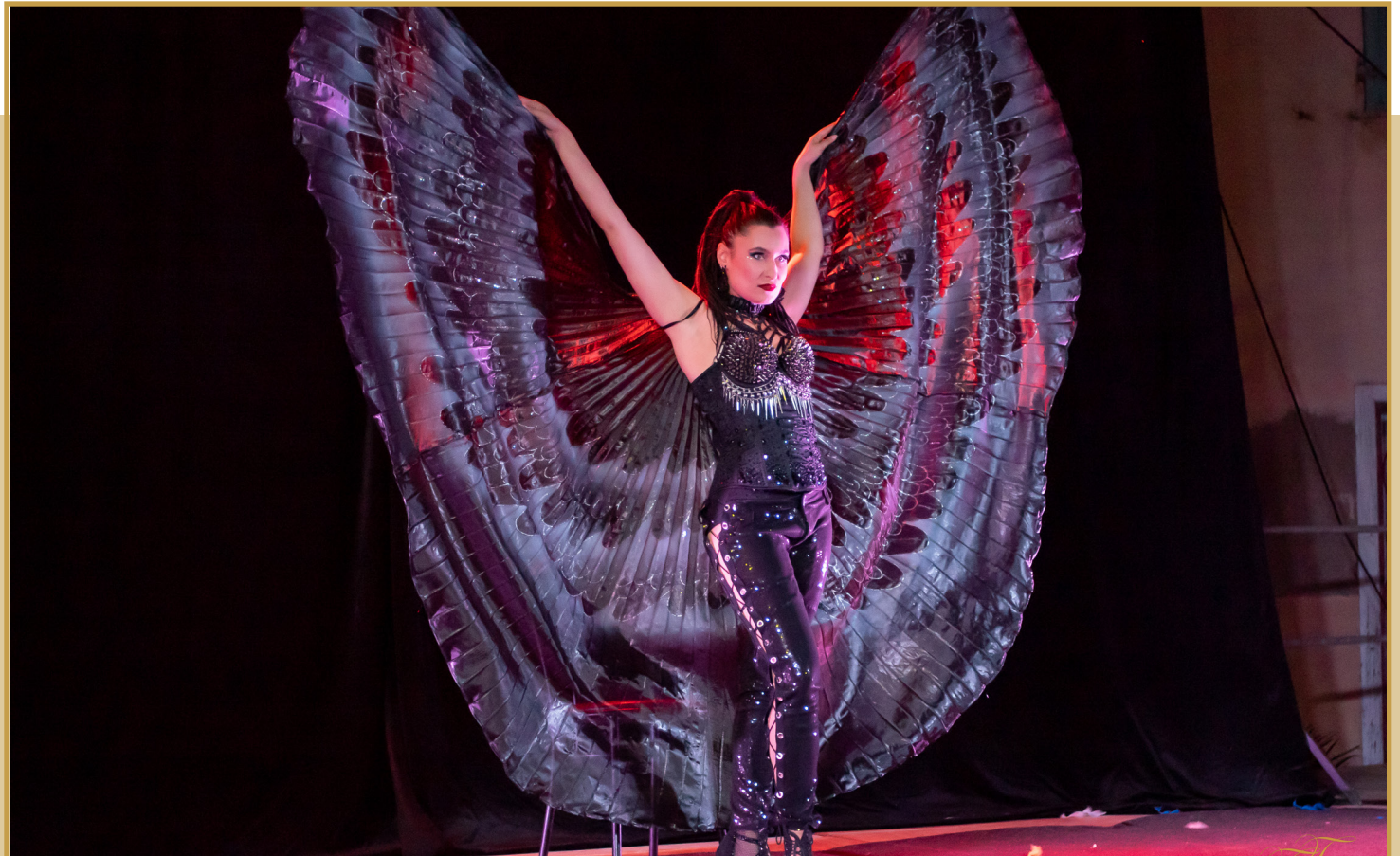
AILES D'ISIS PEINTES AU POGHOIR ET PANTALON À LACETS